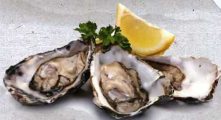
生蚝 S.Q Ostriche