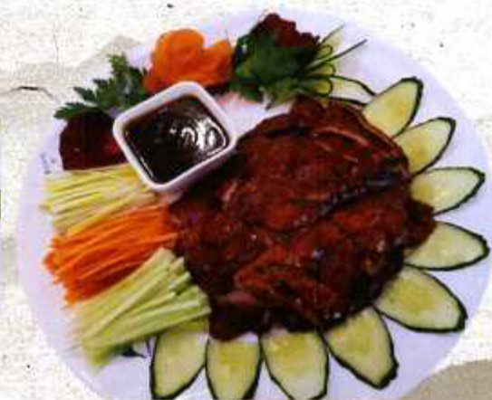
正宗北京烤鸭 ANATRA PECHINESE