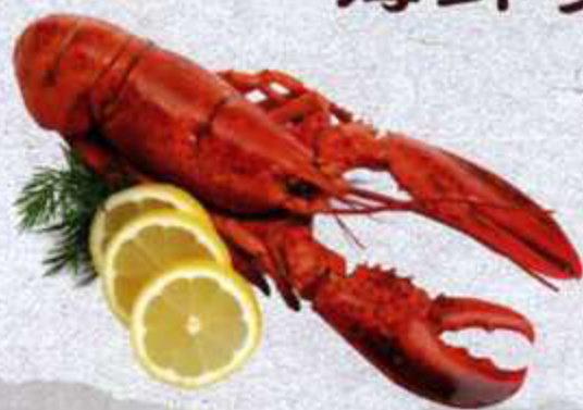
龙虾 S.Q Astice