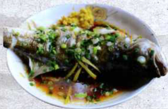
海鲈鱼 S.Q Branzino