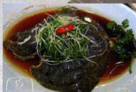
多宝鱼 S.Q Rombo