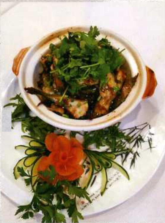
正宗广东砂锅鱼 SPECIALITÀ PENTOLA CON PESCE